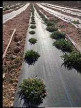
COLLEJAS AL AJILLO →→