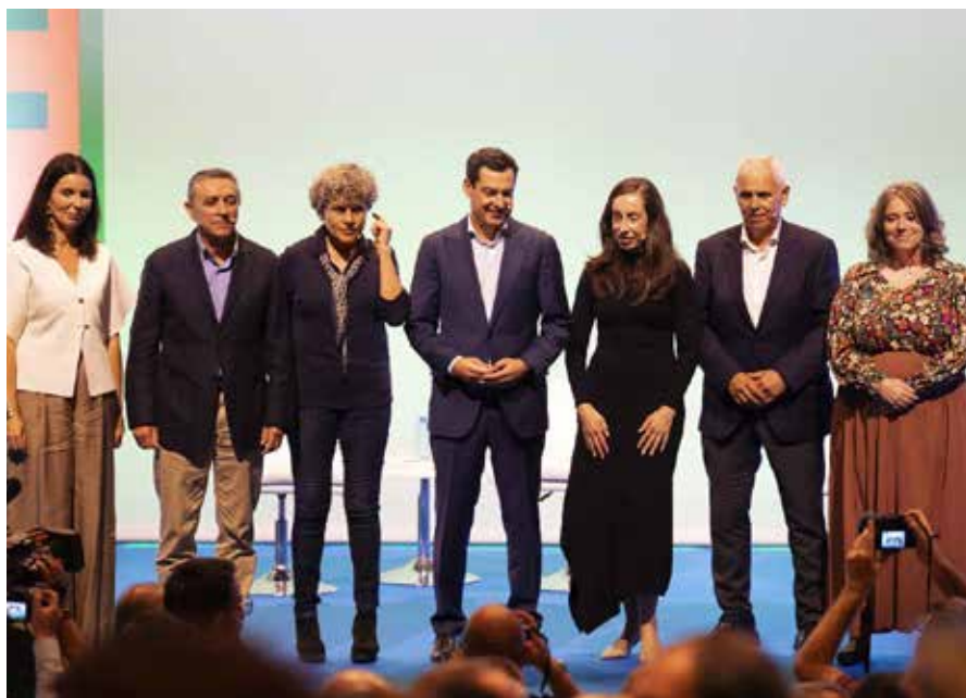
Participantes en el debate que giró en torno a la agricultura, la agroindustria, agua y medio ambiente

El presidente de la Junta de Andalucía, Juanma Moreno, fue el encargado de moderar el debate de este foro organizado por el Partido Popular andaluz en El Ejido, Almería