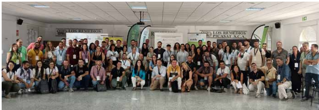
Foto de familia de los participantes en el VI Campus Agroalimentario de Jóvenes Cooperativistas