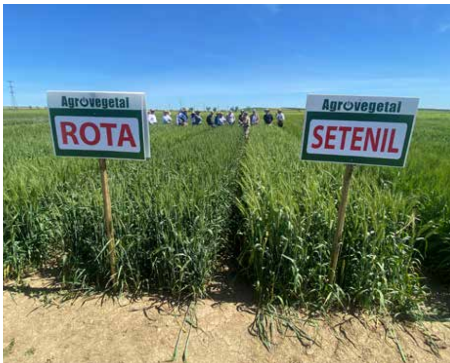
Ensayos de las nuevas variedades de Agrovegetal

Durante las dos campañas de ensayos la pluviometría en Andalucía ha sido alta y los rendimientos han estado por encima de los habituales en la zona.