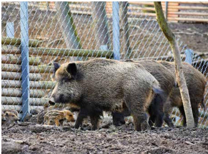
Preocupación en el sector porcino, especialmente de extensivo