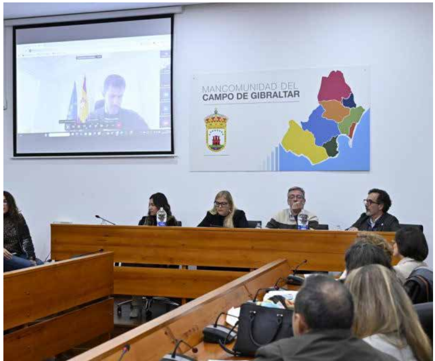
Momento de debate durante la jornada del proyecto Agrosocial

Agrosocial es un proyecto europeo de cooperación transfronteriza, liderado