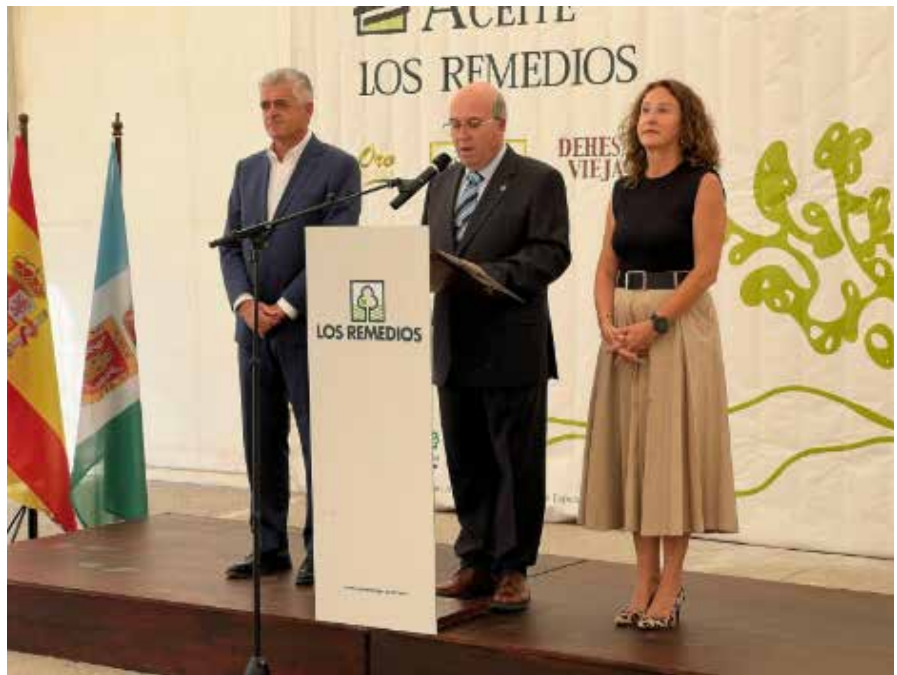
El padrino de este año es un habitual de la televisión autonómica andaluza

Durante estos años la Cooperativa ha ido diversificando sus actividades industriales gestionando además, una almazara ubicada en el municipio de Olvera,