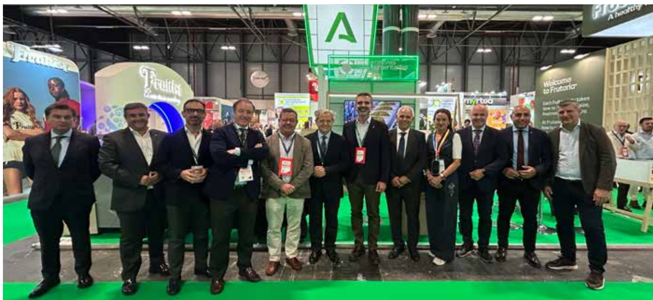
El consejero de Agricultura, Pesca, Agua y Desarrollo Rural visitó el stand de Cooperativas Agro-alimentarias de Andalucía