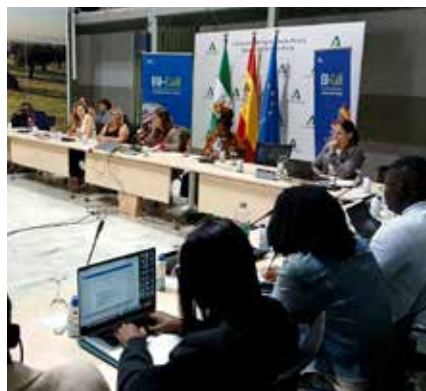
Reunión con los visitantes de los países caribeños.

Esta actividad tiene como objetivo compartir las experiencias reales sobre cómo la innovación, la economía social y el liderazgo de mujeres y jóvenes pue-