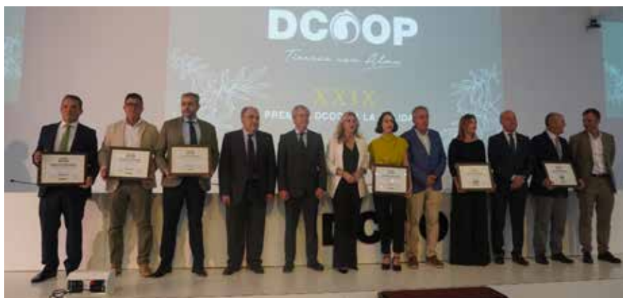
Los premiados posan con sus reconocimientos a la finalización del evento