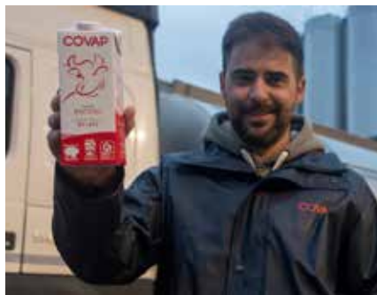
La cooperativa desarrolla un plan integral

El proyecto, iniciado en 2020, se basa en un modelo de evaluación anual y exhaustivo. Se han evaluado 230 ganade-