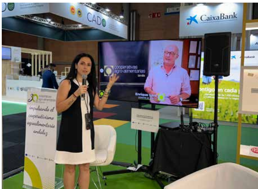
Presentación de la campaña en la edición 2025 de Auténtica

El cooperativismo se consolida como uno de los pilares más sólidos de la economía social andaluza. Este modelo, que sitúa a las personas en el centro de la actividad económica, fomenta la creación de empleo estable y de calidad, el arraigo al territorio y la igual-