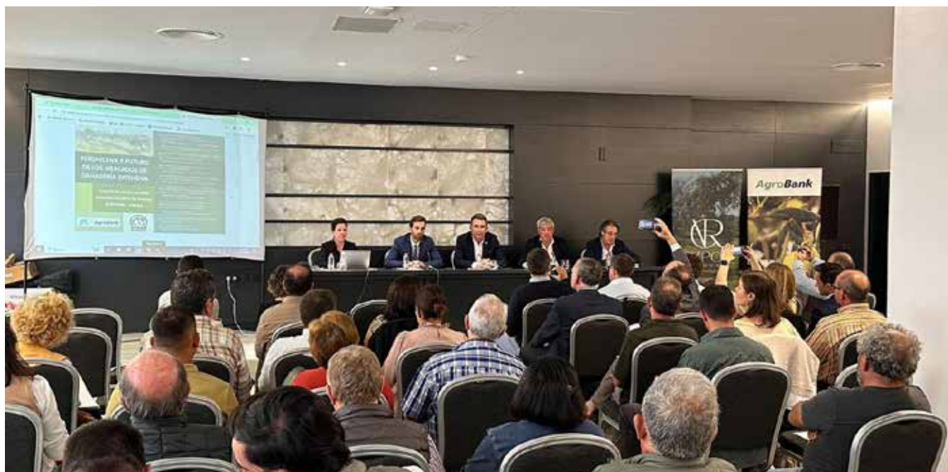
Ganaderos, técnicos, comercializadores, estudiantes y otros profesionales intercambiaron experiencias en el foro onubense