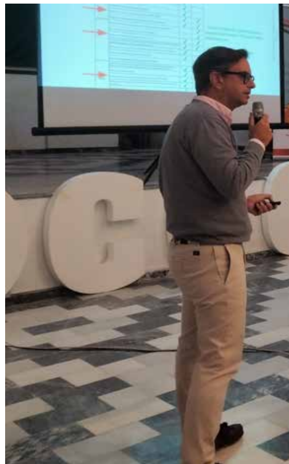
Algunos momentos de la jornada que contó con la participación de