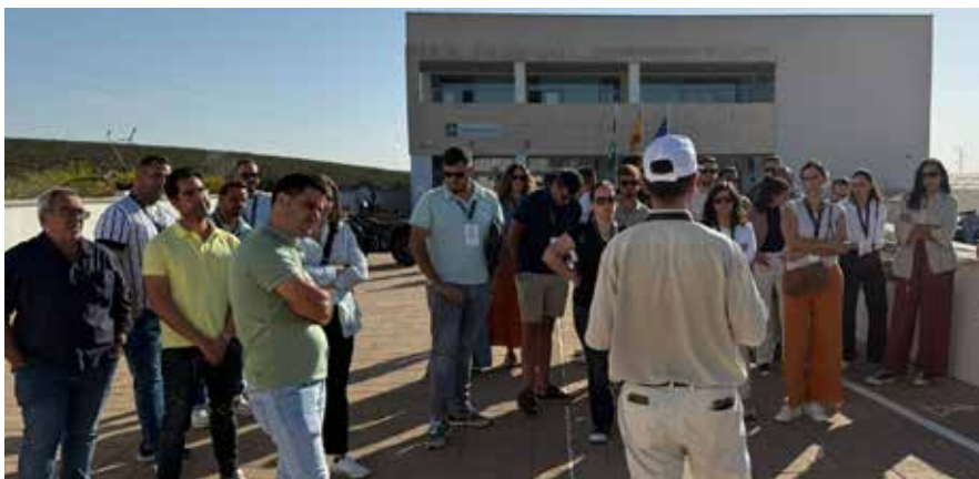
La segunda jornada del evento se celebró en Jerez