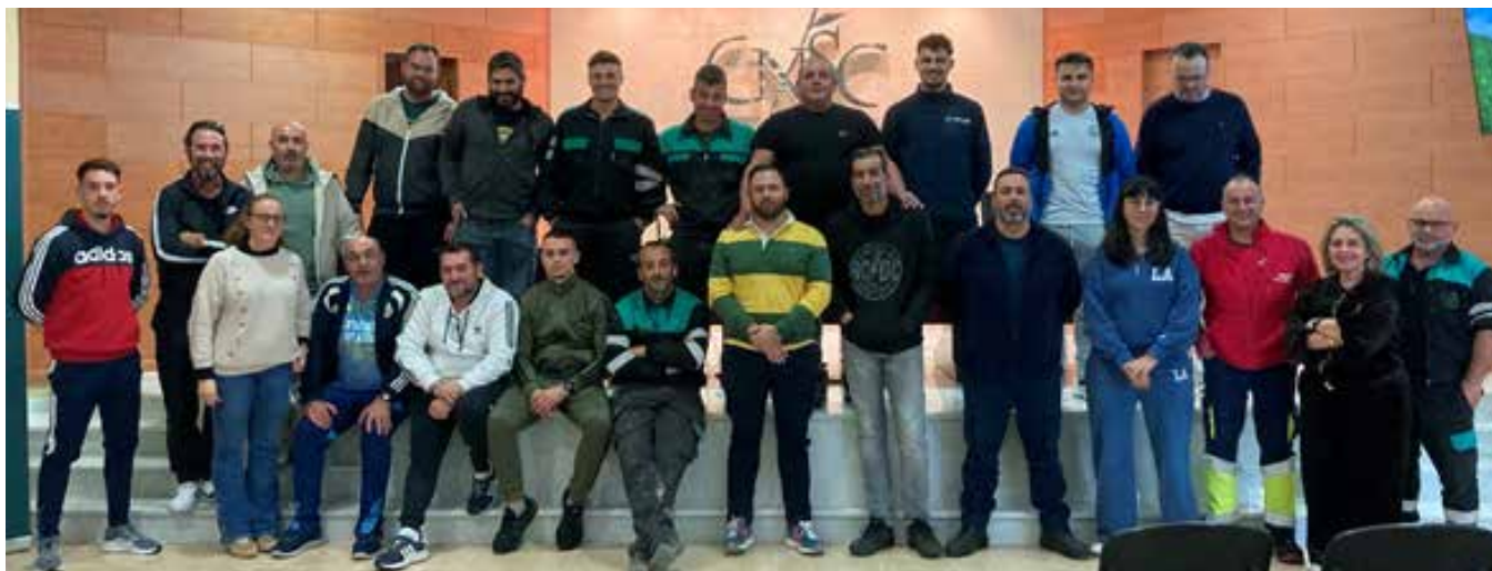
Participantes en las actividades formativas organizadas por Cooperativas Agro-alimentarias de Jaén.