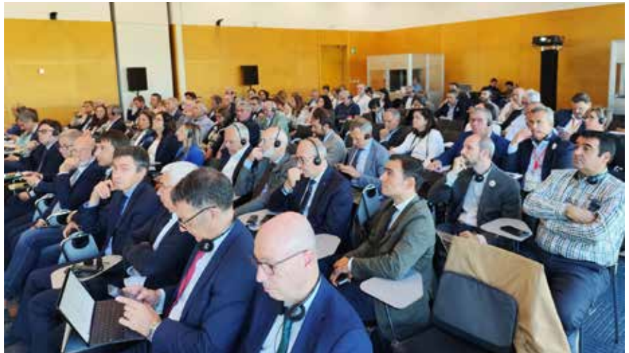
Reunión plenaria del Comité Mixto de Frutas y Hortalizas

El sector ha reconocido como positivo que se mantenga la ayuda finalista a través de programas operativos cofinanciados en función de la facturación de las OPFH. Sin embargo, ha mostrado su preocupación por dos cambios que,