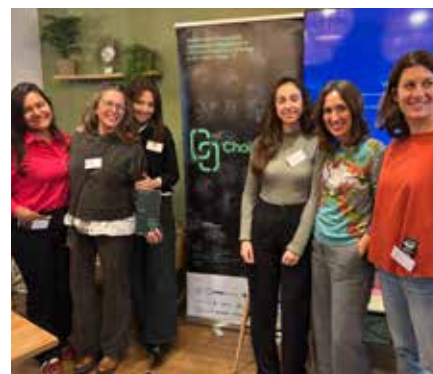
II Asamblea General

Este proyecto trabaja para incrementar la adopción de prácticas sostenibles a lo largo de toda la cadena de valor. Cooperativas Agro-alimentarias de Andalucía es la responsable de desarrollar el piloto en España y tiene a los sectores del olivar y de la ganadería como protagonistas y está prevista la participación de más de más de 200 agricultores y ganaderos andaluces.