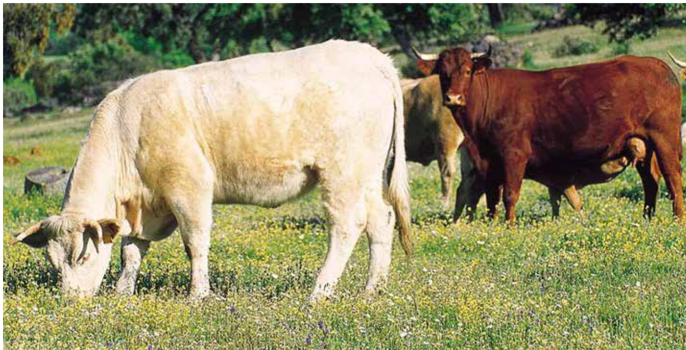
El ganado bovino, de carne y de leche, es susceptible de contraer la enfermedad