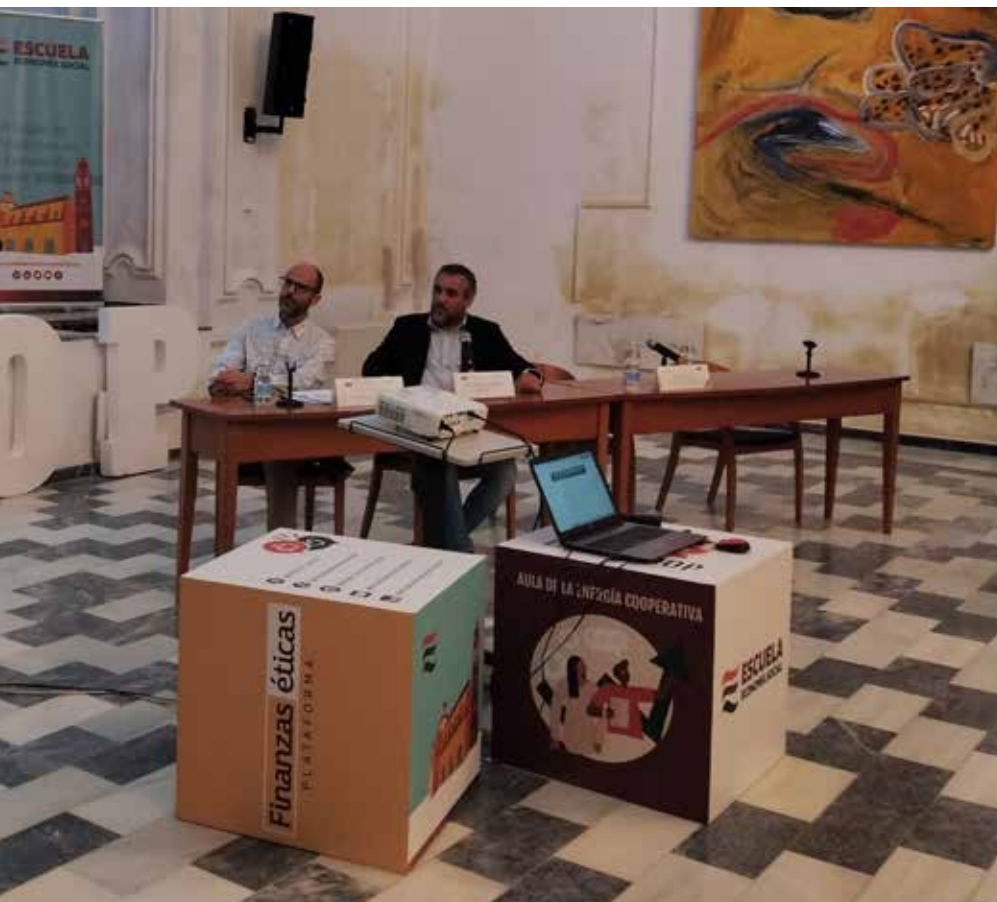
casi un centenar de profesionales e interesantes ponentes

que señalar que, desde la federación regional se presta el servicio de consejero de seguridad a 175 centros de más de 150 cooperativas, a las que se asesora para el cumplimiento de toda la normativa.