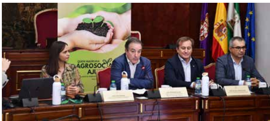
Momento de debate en la mesa redonda

La federación es una de las entidades asociadas al proyecto Interreg Agrosocial, que el pasado 27 de octubre cele-