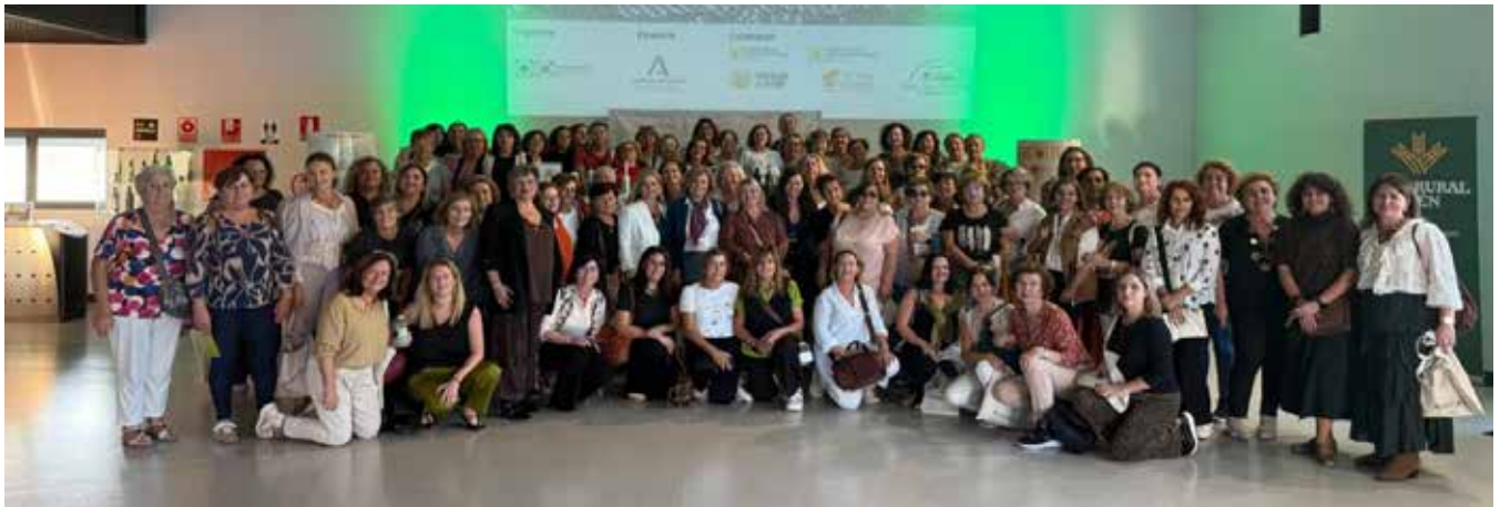
Mujeres del ámbito agrario y cooperativo de las ocho provincias andaluzas acudieron al encuentro celebrado en Jaén