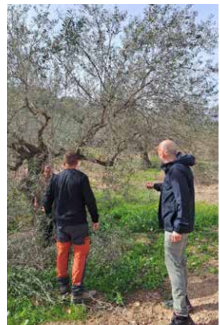
El programa Cultiva ofrece formación práctica

En ediciones anteriores, el programa ha recibido una valoración muy positiva por parte de los participantes, destacando el aprendizaje adquirido en materia de gestión sostenible, innovación tecnológica, diversificación de cultivos, digitalización de procesos o comercialización directa de productos. Iniciativas como estas favorecen el relevo generacional a través de la formación.