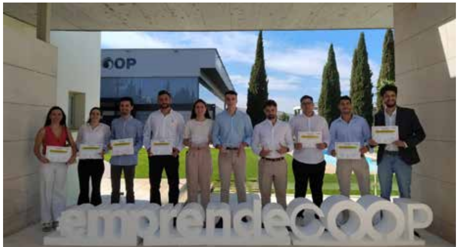
Los componentes del equipo Oleum Folium posan con el premio que los acredita como ganadores

Una de las propuestas ha sido Termoalerta, proyecto orientado al sector de la ganadería caprina lechera, que implementaría sensores en áreas de producción de leche de cabra para la detección y resolución temprana de riesgos