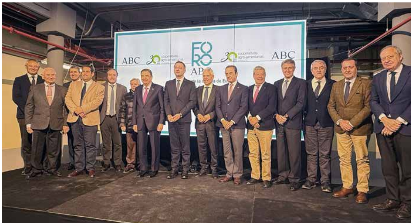
El Consejo Rector de Cooperativas Agro-alimentarias de Andalucía junto al ministro Planas y al comisario europeo Hansen