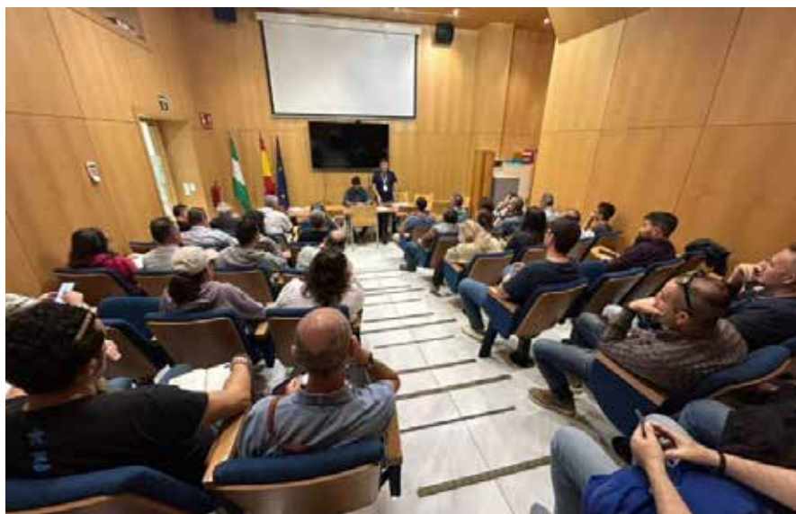
Reunión en la que se acordó la parada biológica para la próxima campaña.