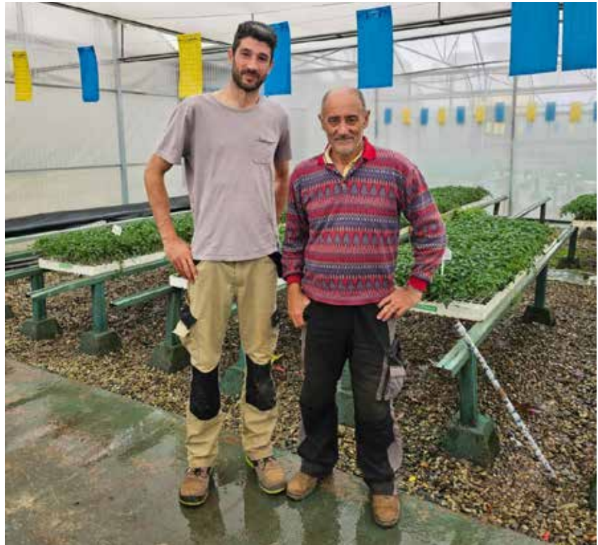
Las estancias permiten el intercambio de experiencias entre generaciones

En la presente edición, veintitres jóvenes visitarán explotaciones modelo andaluzas gracias a las federaciones provinciales de Jaén, Granada, Málaga y Cádiz. La primera de las estancias dará comienzo a principios de febrero y la última se producirá durante la segunda quincena de junio.