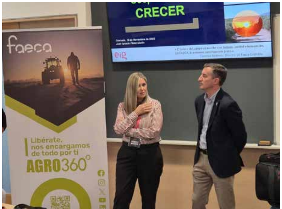
El curso trata de apoyar el liderazgo de sus participantes

Los alumnos y alumnas son miembros e integrantes de Consejos Rectores -incluso presidentes- de cooperativas