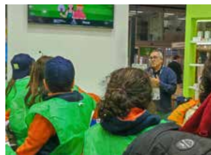
Escolares participantes en Expo Sagris

organizó una sesión didáctica, en el que, a través de dos personajes virtuales, Carmen Campos y Pepe Vaqueros, explican con un lenguaje cercano a los alumnos el origen de las cooperativas y su funcionamiento como pilar de la economía rural. Estos conocimientos se afianzan con dos juegos interactivos.