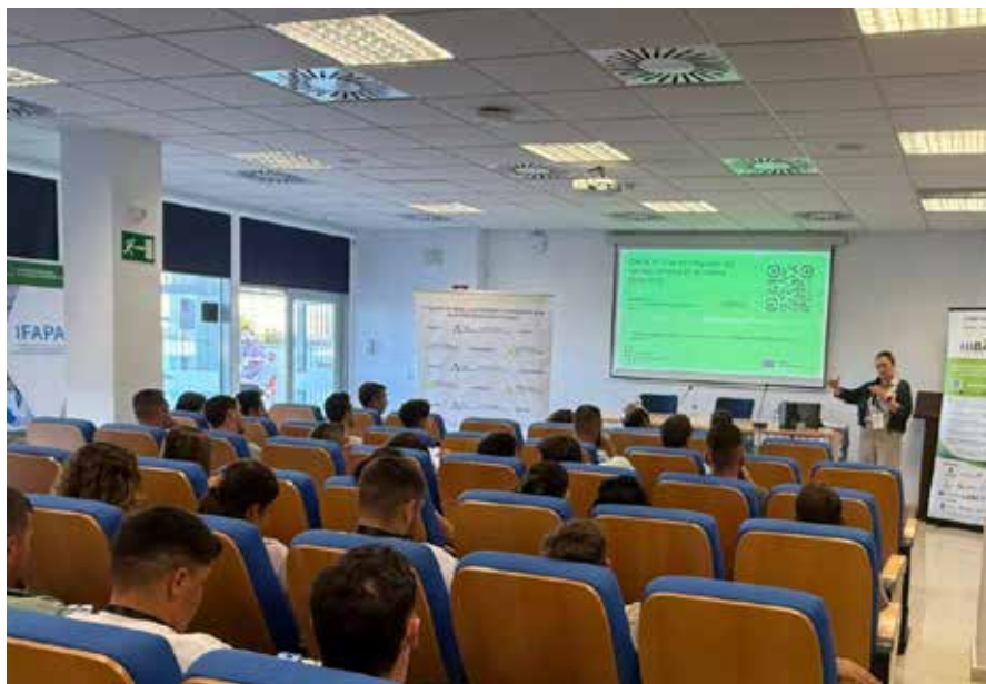
HIBA+ fue uno de los proyectos presentados en el campus

En la zona demo se presentaron las propuestas innovadoras de la Universidad de Córdoba, Grodi, Universidad Loyola, Innogando y, por parte de Andalucía Agrotech DIH, una demo de servicio asociada al catálogo de servicios del proyecto Andalucía Agrotech EDIH, que mostraron desde herramientas de análisis de datos agrícolas, y plataformas de trazabilidad alimentaria, hasta cómo conseguir financiación o probar una tecnología antes de invertir.