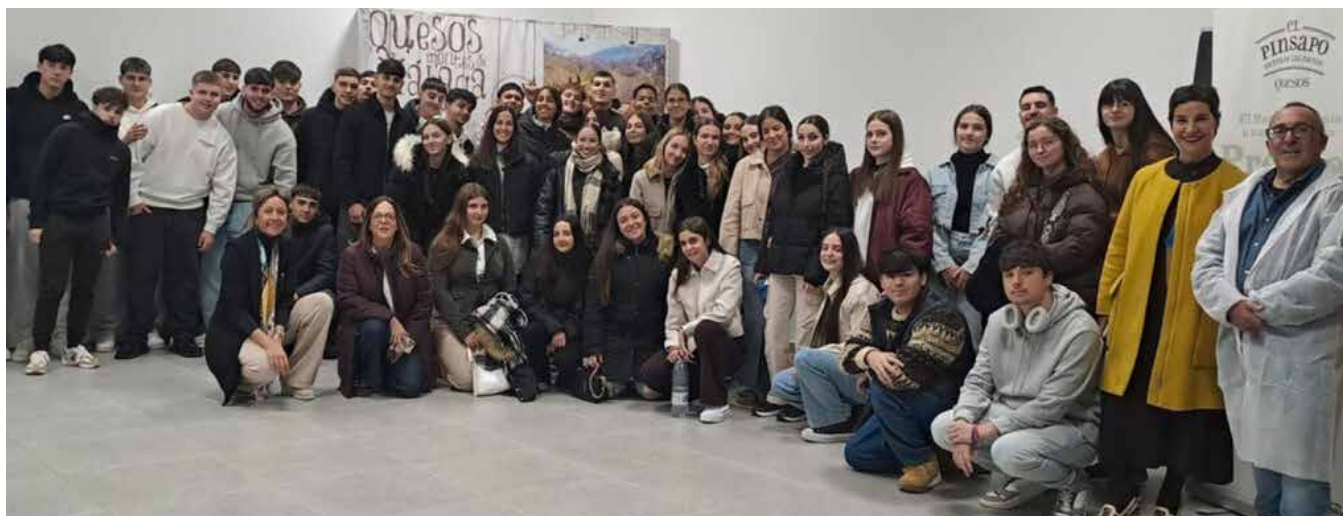
Alumnos del IES Campanillas en las instalaciones de AgammaSur