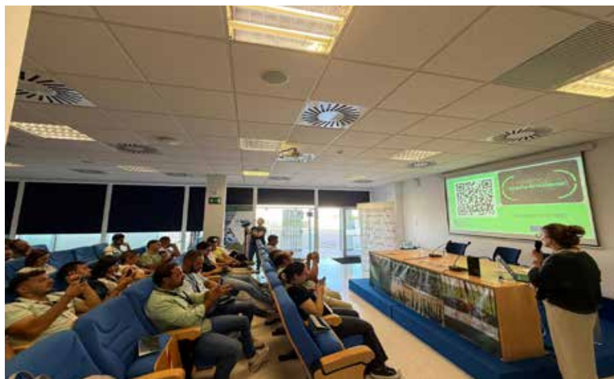
Presentación de la campaña

Todos los vídeos comparten un lema común: que sostenibilidad y rentabilidad pueden ir de la mano