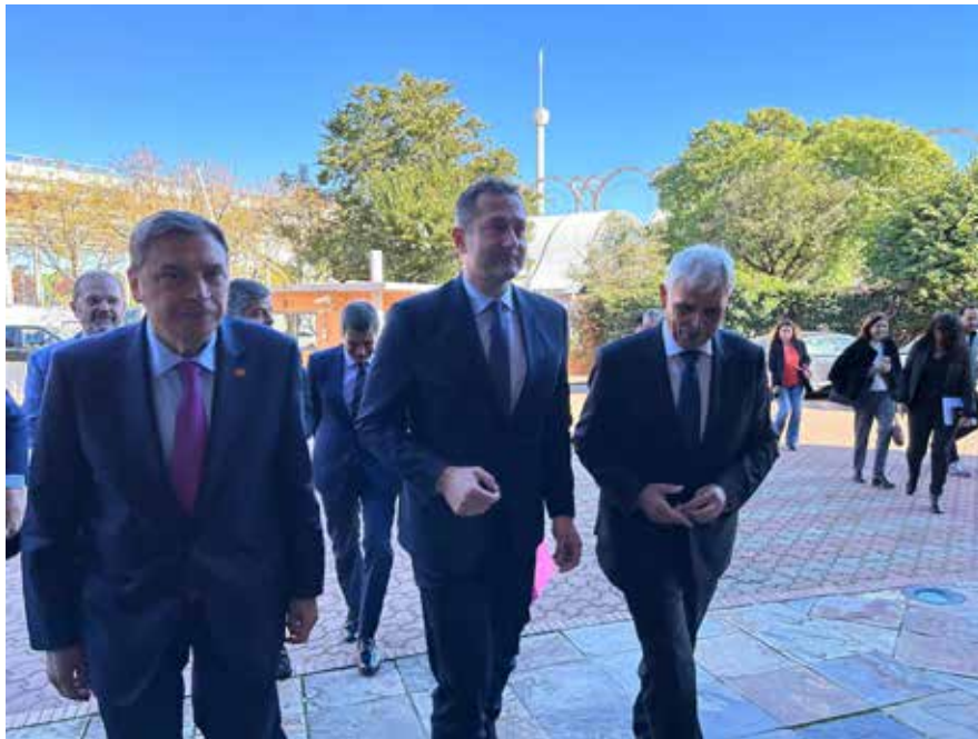
El comisario europeo a su llega al foro junto al ministro y al presidente de la federación regional

La federación regional ha celebrado, de la mano de ABC de Sevilla y a través del 'FORO ABC', sus tres décadas de historia reuniendo en la capital hispalense a cooperativas, organizaciones agrarias y profesionales del sector agroalimentario