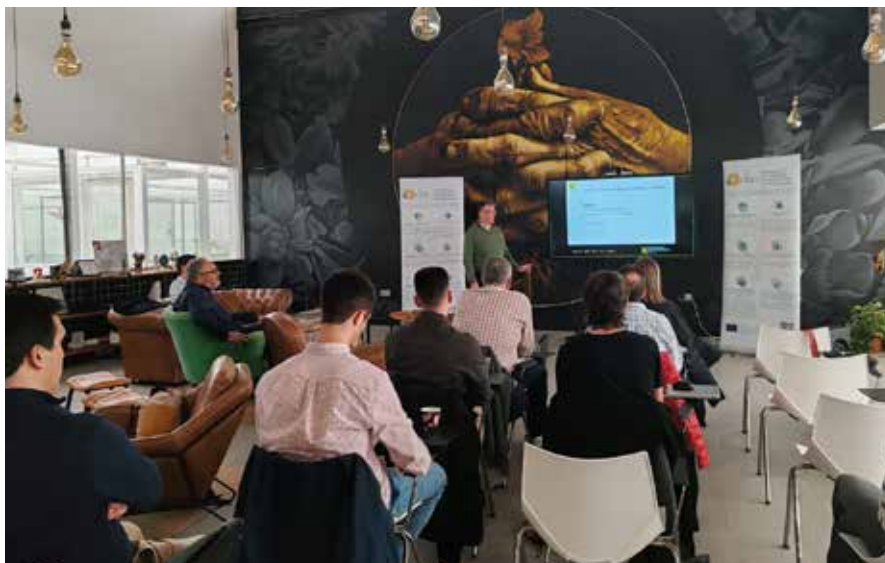
Foto de grupo de los miembros del consorcio Agricare entre los que están dos técnicas de la federación

Celebrada la jornada 'Nuevos cultivos para la bioeconomía en España' en el municipio de Vícar, en Almería