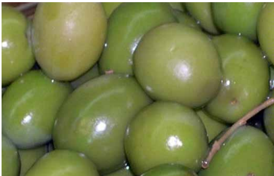
El verdeo avanza con interrupciones por las lluvias